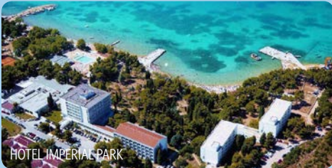
HOTEL IMPERIAL PARK