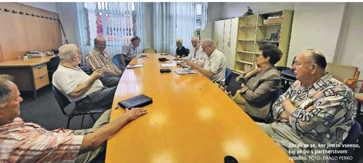
Zbrali so se, ker jim ni vseeno, kaj se bo s partnerstvom zgodilo.