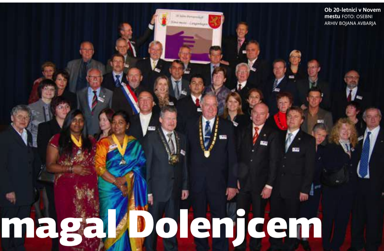
Ob 20-letnici v Novem mestu