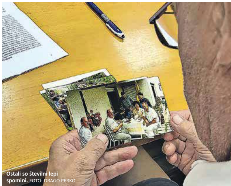
Ostali so številni lepi spomini.