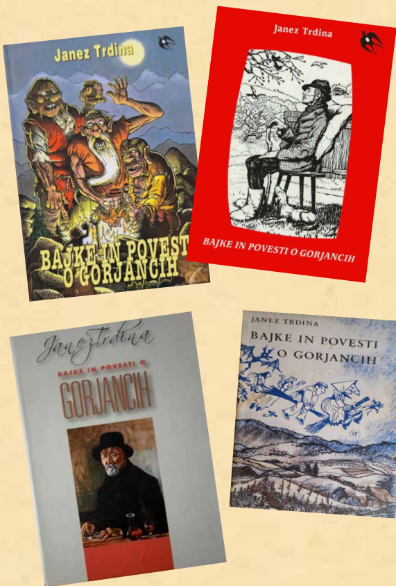
Naslovnice knjige Bajke in povesti o Gorjancih